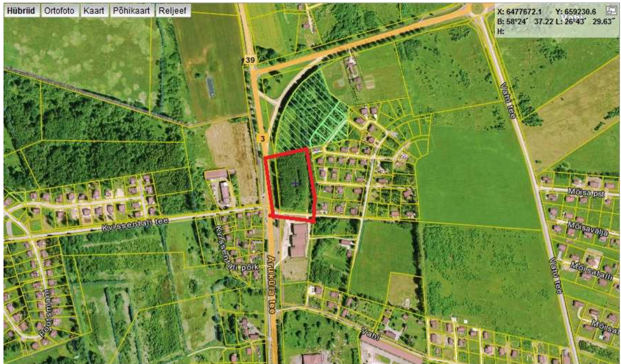
— PLANEERINGUALA PIIR